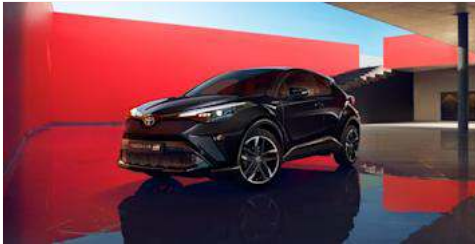
Toyota C-HR Hybrid