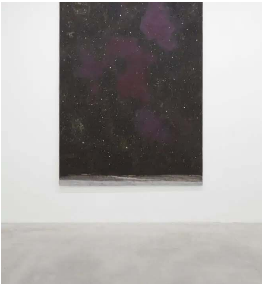
Mappa di stelle, 2019

Quella di Addamiano è una pittura fatta di pennellate dense e stratificate, che assorbono lo sguardo dello spettatore come se questo si trovasse effettivamente davanti a una sterminata distesa celeste, in una contemplazione non solo estetica ma anche -e soprattutto- emotiva.